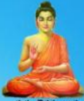
గురు గోరమ బుద్ధ