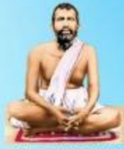
గురు రామకృష్ణ పరమహంస, అమ్మ శారదాదేవి