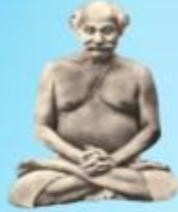
గురు లాహిరి మహాశయి