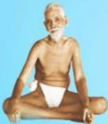
గురు రమణ మహర్షి