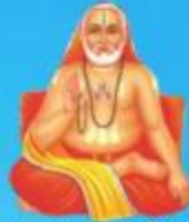
గురు రాఘవేంద్ర స్వామి