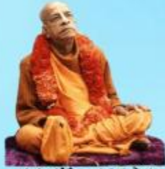
గురు భక్తవేదాంత ప్రభుపాద