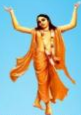
గురు చైతన్య మహా ప్రభువు