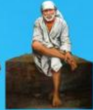
గురు హాయి బాలా