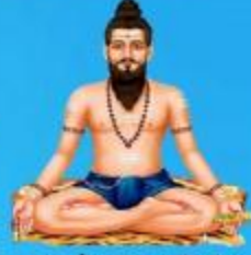
గురు వీరబ్రహ్మేంద్ర స్వామి