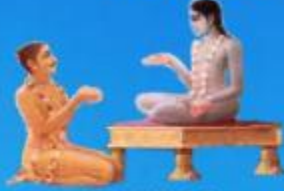
గురు శుక మహర్షి