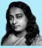
గురు భక్తవేదాంత ప్రభుపాద