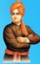
గురు హాయి బాలా