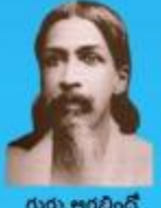
గురు రమణ మహర్షి