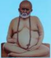
గురు వైలింగ్ స్వామి