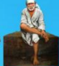
గురు హాయి బాలా