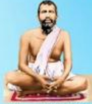
గురు రామకృష్ణ పరమహంస, అమ్మ శారదాదేవి