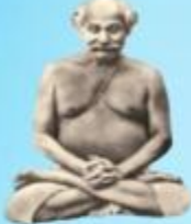
గురు లాహిరి మహాశయి