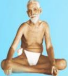
గురు రమణ మహర్షి